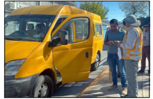
Realizan fiscalización al gremio del transporte escolar.