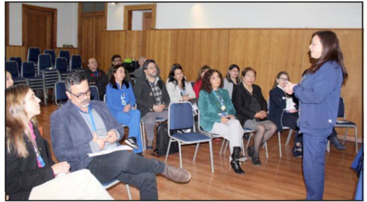
Equipo de profesionales generó esta pionera iniciativa.

« Este proyecto surgió de un grupo de profesionales de