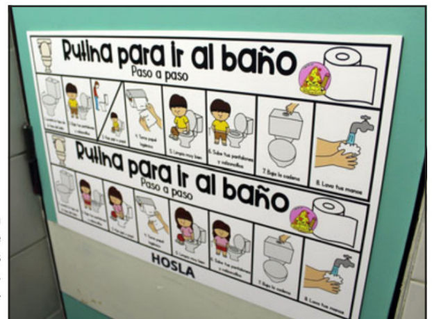
Estas son parte de las medidas adopta-