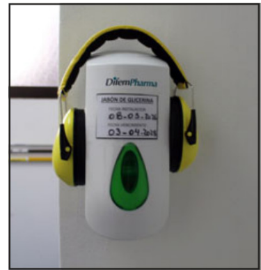
Trabajo ha permitido generar un espacio seguro para los menores con TEA.

Por este motivo, tanto sus gestoras, como las autoridades e invitados en la presentación del mismo, compartieron la opinión que es replicable en otros establecimientos de salud públicos y privados.