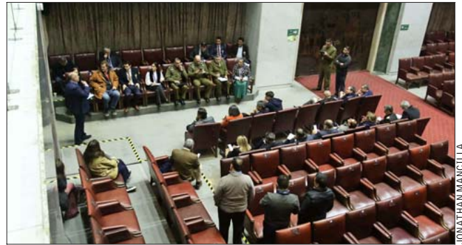
Equipos de la Presidencia de la República viajaron desde Santiago, entre ellos de prensa y la Secom, para saber de los preparativos.

Un ítem que legisladores se aventuran estará de todas maneras presente será en de la migración, en que dan por descontados anuncios para contener los ingresos irregulares al país.