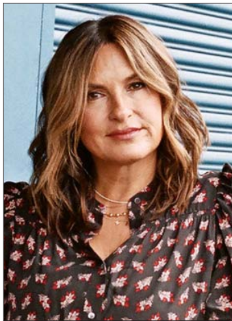
NEW YORK TIMES