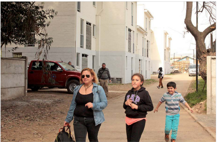
Los componentes del déficit habitacional involucran allegados por hacinamiento, viviendas irreparables y allegados por incapacidad financiera.