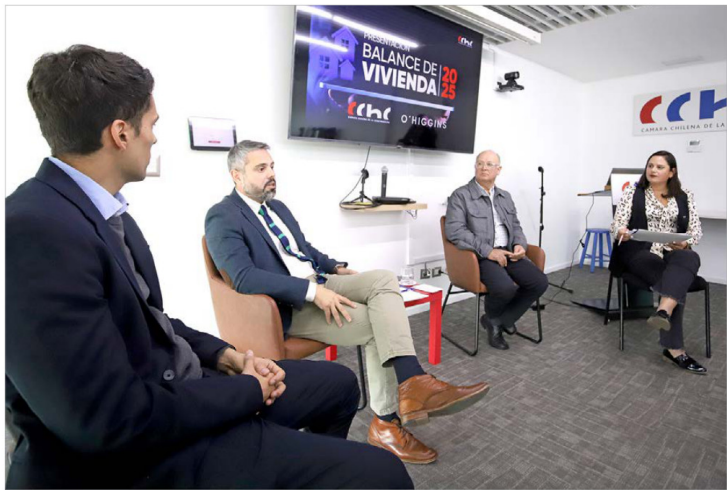
Aunque las cifras se han reducido respecto al 2023, no ha sido suficiente para combatir un desafío de proporción nacional.

Finalmente, se habló de avanzar hacia una densificación más realista y equilibrada, como hacer un uso eficiente del suelo para reducir su incidencia en el costo de la vivienda. Igualmente, se abordó dotar al Ministerio de Vivienda y Urbanización (MINVU) de la potestad para iniciar procesos de ampliación de territorios operacionales para proyectos de interés público y avanzar en la modificación del marco regulatorio sanitario.