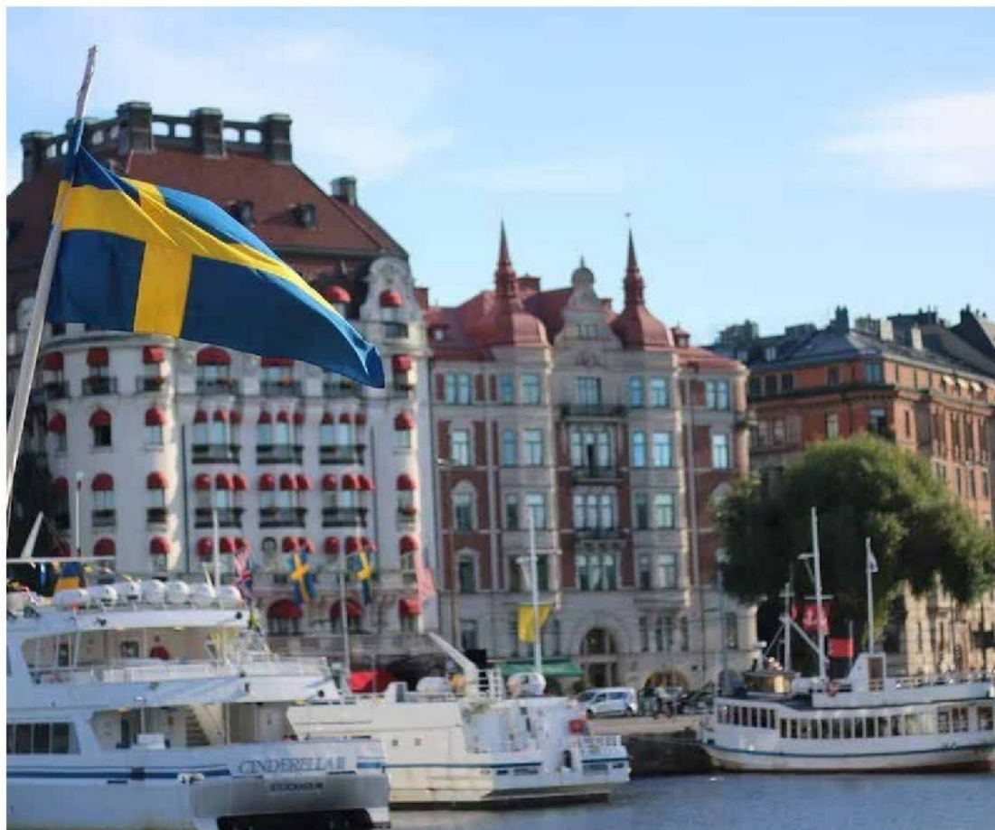
► El pintoresco paseo marítimo de Strandvägen en Estocolmo, Suecia.

“Suecia es una verdadera tierra de oportunidades”, dijo a The Wall Street Journal , Elisabeth Svantesson, ministra de Finanzas del país. “Quiero que la gente y el capi-