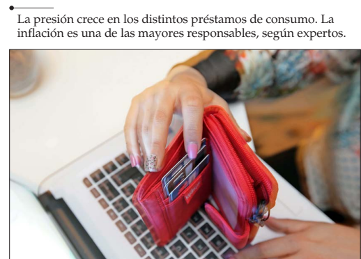
El interés que se cobra por usar tarjetas de crédito es el factor más relevante en el promedio mensual.