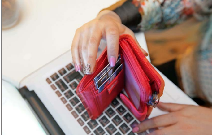
El interés que se cobra por usar tarjetas de crédito es el factor más relevante en el promedio mensual.

La presión crece en los distintos préstamos de consumo. La inflación es una de las mayores responsables, según expertos.