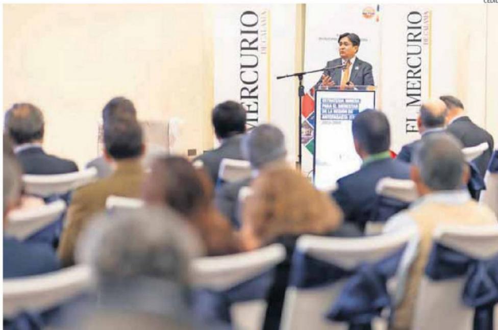
EL SEMINARIO, LIDERADO POR EL GOBERNADOR, SIRVIÓ PARA PRESENTAR LA ESTRATEGIA MINERA REGIONAL DE ANTOFAGASTA (EMRA) EN CALAMA.

La presentación también incorporó proyectos vinculados a reutilización hídrica, saneamiento, infraestructura de salud y conectividad regional, además de iniciativas de mediano plazo como la concesión del aeropuerto Calama-Antofagasta y proyectos ferroviarios y viales asociados al desarrollo regional. Proyectos con foco en el mejoramiento de la calidad de vida, que es el primer objetivo estratégico de la EMRA.