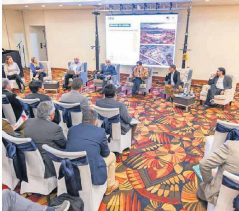
LA ACTIVIDAD CONSIDERÓ UN CONVERSATORIO Y LUEGO DIO PASO A LAS INQUIETUDES DE LOS ASISTENTES.