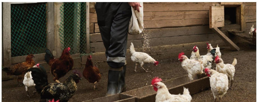
LAS AVES SILVESTRES ACTÚAN como los principales vectores de la influenza aviar en la zona central, iniciando contagios que puede alcanzar a planteles industriales.