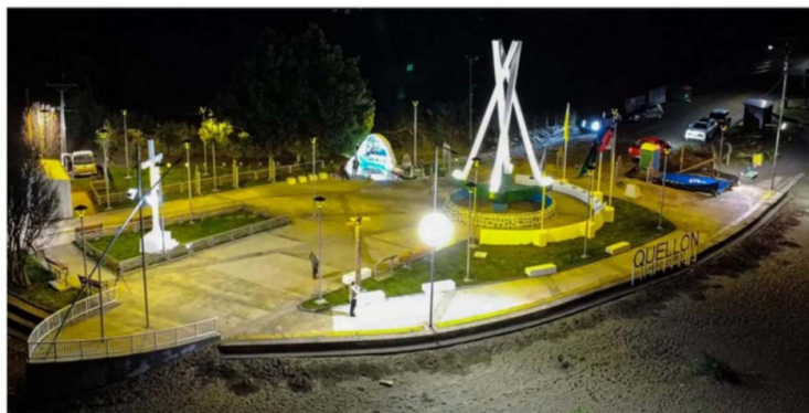
EN LA FASE DE RECEPCIÓN SE ENCUENTRAN LOS TRABAJOS EN EL SECTOR DE PUNTA DE LAPAS.