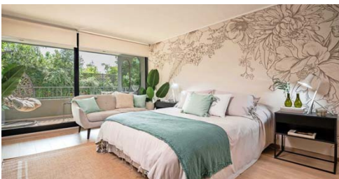
Las unidades de tres y cuatro dormitorios apuntan a quienes requieren mayores espacios en una ubicación estratégica.

“Con la escrituración y entrega proyectada para el segundo semestre de este año, Candelaria 4500 es hoy una excelente opción para quienes necesitan concretar su compra a corto plazo”, concluyen.