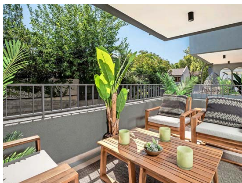
El proyecto inmobiliario incorpora soluciones tecnológicas enfocadas en la seguridad y la comodidad de los residentes.

que buscan migrar desde casas de gran tamaño hacia espacios más eficientes sin perder calidad de vida