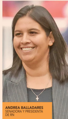
ANDREA BALLADARES SENADORA Y PRESIDENTA DE RN

aplicación eventual de la invariabilidad tributaria por 25 años y advierte que "si estamos hipotecando el país, necesitamos tiempo para estudiar el proyecto y para escuchar a las personas que entienden los temas".