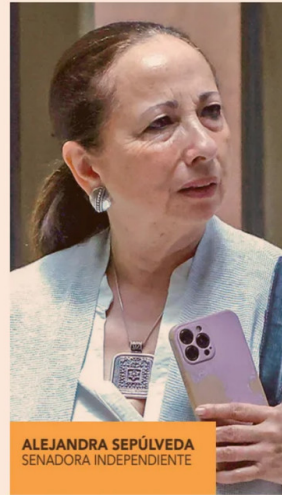
ALEJANDRA SEPÚLVEDA SENADORA INDEPENDIENTE