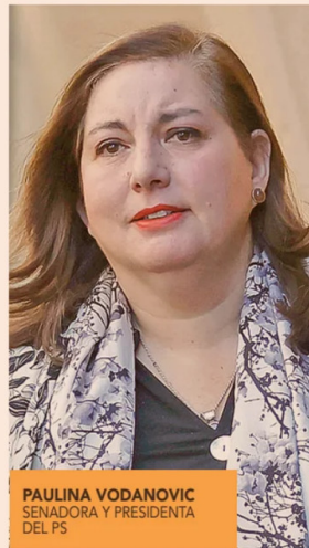
PAULINA VODANOVIC SENADORA Y PRESIDENTA DEL PS