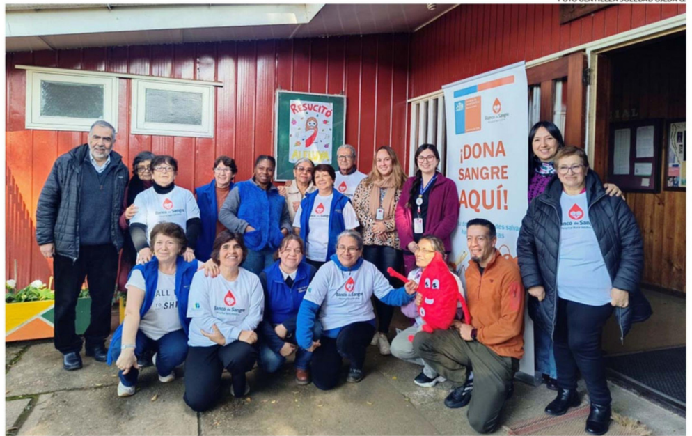
LOS VOLUNTARIOS DEL GRUPO SON INTEGRANTES DEL GRUPO DE MISIONEROS SEMBRADORES DE ESPERANZA DE LA PARROQUIA CRISTO REY DE VALDIVIA.