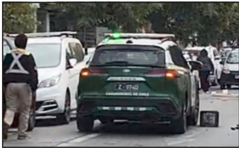
Carabineros debió actuar para detener a un sujeto por agresiones y amenazas.

«Esta labor es un trabajo que se realiza de forma constante con el único fin de dar ordenamiento a la ciudad, de tener calles despejadas, que las veredas sean utilizadas para el tránsito peatonal, y no sean apropiadas negativamente por el comercio informal», cerró.