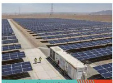
Con una inversión de US$29,4 millones, Subestación Andacollo proyecta empleo local.