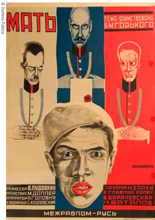
«La madre» (1926), el proyecto que Pudovkin presentó para el grandioso fresco fílmico que el gobierno soviético necesitaba para celebrar los 20 años de la abortada Revolución de 1905.

Otra versión cinematográfica de interés fue la que el cineasta soviético disidente Gleb Panfilov (1934-2023) realizó en 1990 con co-producción italiana y un premio especial en Cannes. El dramaturgo alemán Bertolt Brecht (1898-1956) estrenó en Berlín su adaptación teatral, con su esposa, la gran actriz Helene Weigel, influenciado por las ideas del “distanciamiento” adaptadas de las teorías de Vsévolod Meyerhold (1874-1940), ilustre víctima de Stalin y profesor de Eisenstein y Pudovkin.