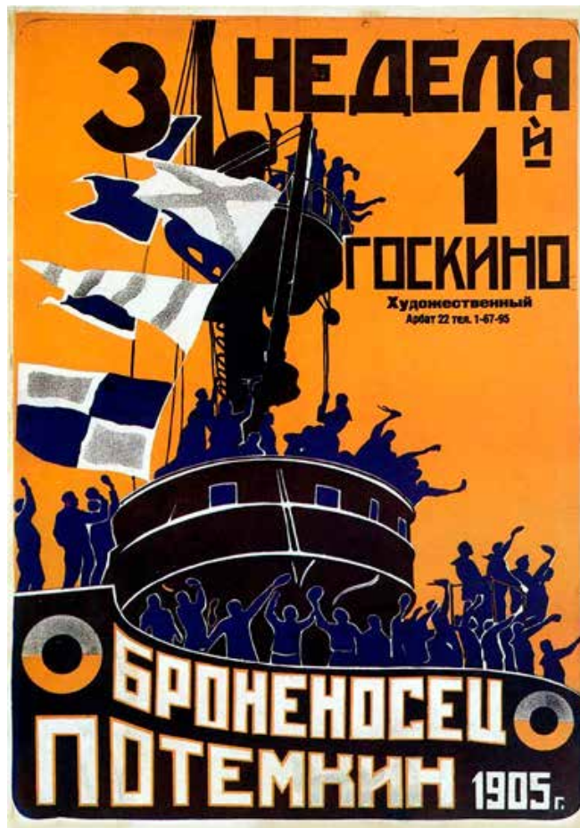
«El acorazado Potemkin» de Serguéi Eisenstein (1925).