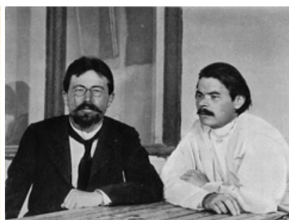
Gorki junto a Antón Chéjov (izquierda) en Yalta (1900)