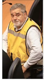
Según el abogado, pareja de exministra Vivanco solo buscaría "mejorar su situación procesal".

Galerías del centro de Santiago Una red de espacios públicos fundamentales del tejido urbano de la capital.