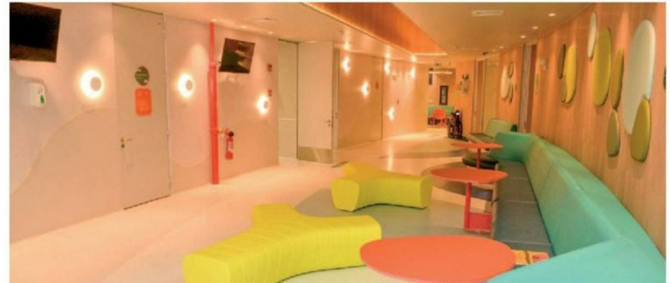
© Muestra espacio de sala de segundo piso.