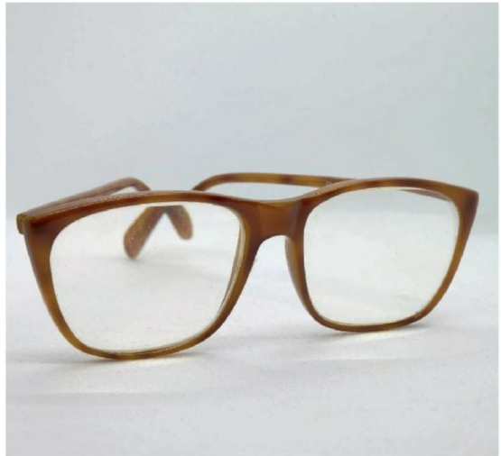
► Sus anteojos también son parte de su patrimonio personal.

La joya de la corona es el manuscrito original de Persona non grata , el libro de 1973 donde Edwards dejó testimonio sobre sus experiencias como embajador de Chile en Cuba.