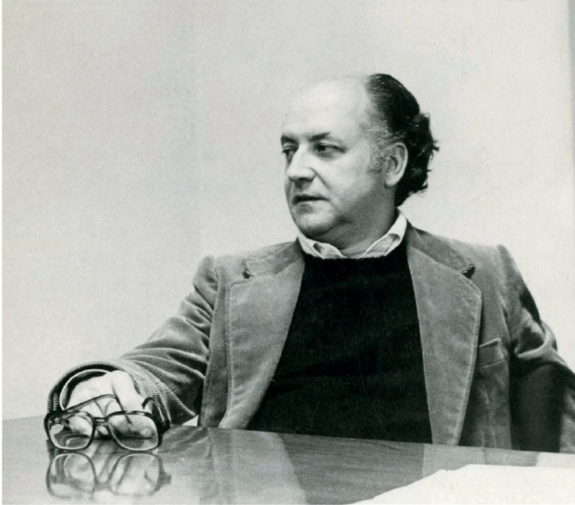
► Jorge Edwards obtuvo el Premio Nacional de Literatura y el Premio Cervantes.