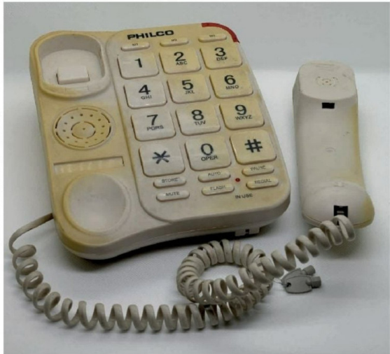
► El Archivo resguarda objetos personales, como este teléfono.