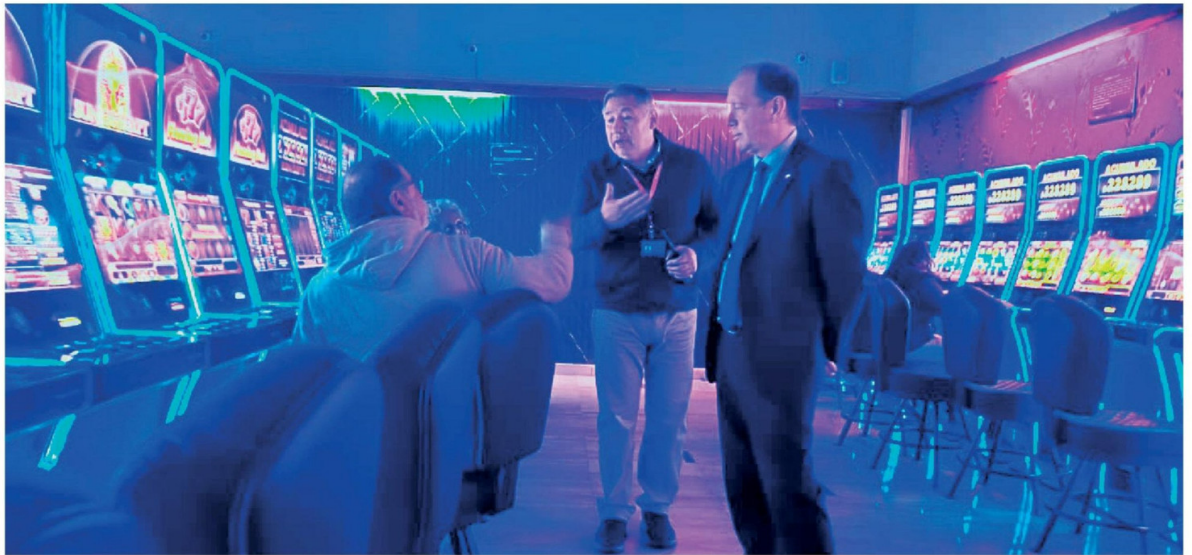
EN LOS ÁNGELES, la última fiscalización y clausura fue hace ya más de tres semanas.

En este contexto, en entrevista con Diario La Tribuna, el senador Gastón Saavedra sostuvo que los casinos clandestinos "están fuera de la ley" y que las instituciones deben utilizar