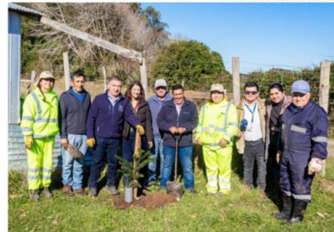
LA INICIATIVA BUSCA RESCATAR, PRESERVAR Y FORTALECER LA IDENTIDAD CULTURAL ANCESTRAL DE LA ARAUCANÍA.