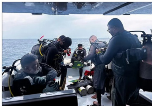
Este es el grupo de buzos rescatistas.

Este sábado falleció el experimentado buzo que lideraba las tareas de rescate de los exploradores.