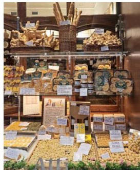
PASTA, PASTA, PASTA. Los capeletti se comen con salsa pamesana o en sopa, al brodo.

apanada, bañada con pamesano. Fea pero rica, se advierte. Se diferencia mucho de la milanesa porque se cuece antes de freírse. Y se nota la diferencia. Es suavecita. Con papas fritas, realmente valió volver. De postre, una panna cotta con fragole , o sea, ese flan de “crema cocida” con una salsa de frutillas.