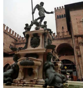
NEPTUNO. Cerca de esta fuente, el bar Vittorio Emanuele tiene un maravilloso tiramisú.

Para bajar la comida de la Taberna de la Osa (traducción), uno puede ir parando en alguna de las cremerías , lugares de venta de helados, o darse una vuelta por el Mercato delle Erbe , donde en horarios tempranos uno puede hacerse de algunas aceitunas marinadas o de alguna fruta para no abusar tanto de los platos tan engordadores de la ciudad. La grassa... , ¿no?