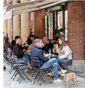
VIA DELL’INDIPENDENZA. Los fines de semana se vuelve peatonal.

apanada, bañada con pamesano. Fea pero rica, se advierte. Se diferencia mucho de la milanesa porque se cuece antes de freírse. Y se nota la diferencia. Es suavecita. Con papas fritas, realmente valió volver. De postre, una panna cotta con fragole , o sea, ese flan de “crema cocida” con una salsa de frutillas.