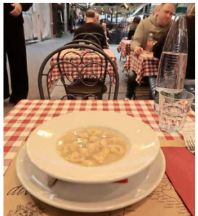
VIA DEGLI ORIFICI. Aquí encuentra a Mattarello y su sopa con capeletti.

Como turistas despistados, recién arribados desde el aeropuerto Guglielmo Marconi, entramos hambreados al primer local que parecía algo hipster (bonito logo, juventud en polera atendiendo), el Allegra . Allí nos encontramos con algo que ya sabíamos: que pedir pasta delgada con salsa boloñesa es una lesera. Como mínimo, unos tagliatelles planitos, para que ayuden