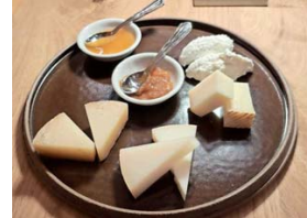
FACTURA PROPIA. Quesos del restaurante Zivieri, una de las novedades del momento.