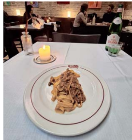
ALLEGRA. Tagliatelle a la boloñesa como debe ser: nada de nadando en salsa.

Para poder llegar vivos al postre, se fue directo al fondo. Otra vez con un clásico boloñés: la cotoletta al estilo del lugar. Y, la verdad, para qué andamos con wikipedismos : es una escalopa muy fina con queso y jamón crudo ( prosciutto! en este caso),