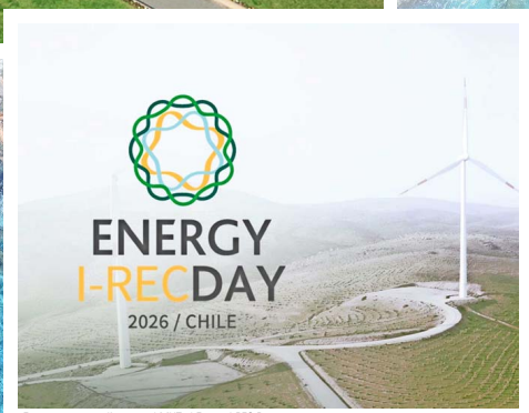
Este martes se realizará en el MUT el Energy I-REC Day.