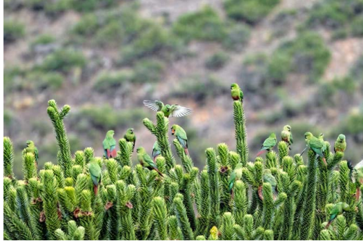
ALTO BIOBÍO. Ubicada en La Araucanía andina, cerca del paso Pino Hachado, esta reserva tiene un paisaje más de estepa patagónica. También existe gran variedad de aves.

“No me gusta comparar, pero isla Mocha es como una mini isla Robinson Crusoe: tiene paisajes con cerros y planicies. Y además una historia literaria, en este caso ligada a Moby Dick. Es un lugar que merece ser visitado”.