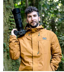
AUTOR. Benjamín Valenzuela Wallis planea terminar esta ruta en agosto.

KAWÉSQAR. Esta reserva solo tiene acceso marítimo. Uno de sus mayores hitos es el Fiordo de las Montañas.