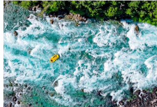
AVENTURA. Ir a los miradores de la Reserva Futaleufú es un gran complemento a los clásicos descensos en rafting.