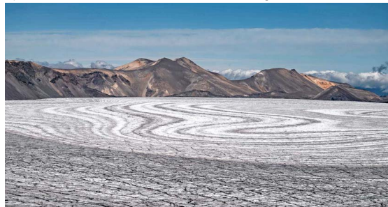
HELIO. El cráter del volcán Sollipulli, que forma parte de la Reserva Nacional Villarrica, está cubierto por un glaciar. Esta ruta se puede seguir con más detalles en el canal de YouTube de Benjamín Valenzuela Wallis.