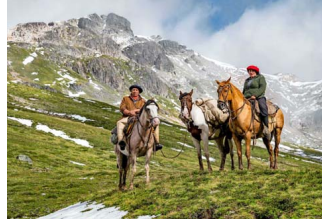
LAGO PALENA. A esta reserva nacional se llega a caballo. El viaje dura unas ocho horas y se hace con arrieros.

"Visitar esta reserva entrega muchas enseñanzas: la principal es que ves en terreno lo dañina que puede ser la acción humana y la importancia de seguir las normas y cuidar estos lugares. Un incendio arrasó con gran parte de estos bosques de araucarías en marzo de 2015, pero se ha ido recuperando. La resiliencia que tienen estos árboles, su capacidad para sobrevivir a catástrofes de esta magnitud, es impresionante.