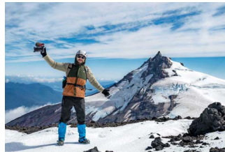
POSTAL. El fotógrafo con el volcán Choshuenco de fondo. Ahora hay un nuevo camino de acceso a esta reserva.