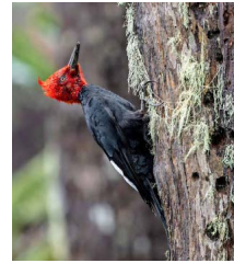
VIDA. El bosque de China Muerta se ha ido recuperando tras el incendio de 2015.

"Nosotros fuimos ahora en verano y llegamos en auto a la entrada misma de la reserva (en invierno puede ser más complejo, cuando cae nieve). Dentro de la reserva está el cálido Refugio Mocho-Choshuenco , donde puedes acampar o quedarte en una tiny house que tienen allí. El refugio está asociado al Club Andino de Valdivia. "La actividad principal de esta reserva consiste en subir el volcán Mocho-Choshuenco . La ruta es larga y extenuante: demoras unas 9 horas ida y vuelta, con 1300 metros de desnivel. En una parte hay que caminar durante tres kilómetros por el glaciar usando crampones. Se debe ir con guías certificados: nosotros fuimos con Choshuenco Experience. "Al final llegas hasta la punta del volcán Mocho, y ves todos los volcanes de la zona: el Choshuenco que está al frente, el Osorno, el Puyehue, el Puntagüedo. Es un espectáculo".