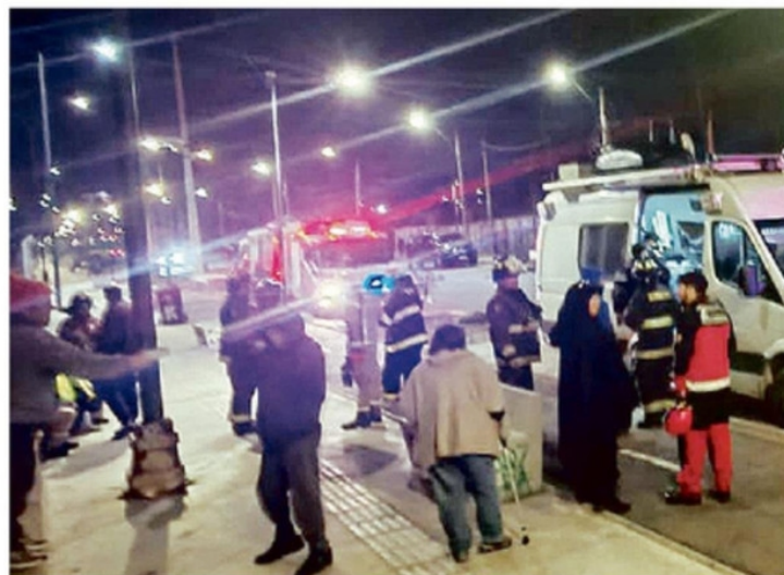
LA PERSONAS FUE RESCATADA CON HIPOTERMIA.

Tras el rescate, recibió las primeras atenciones