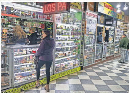
Ventas han caído en 50%. Competencia ambulante y malls chinos inciden.