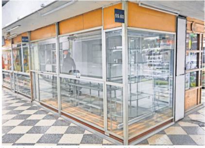
La galería presenta locales vacíos que están impedidos de ser arrendados.

“Hay que poner un tope a las empresas” Anselmo Villagra, seremi de Vivienda, analiza la paralización de obras en la zona. PÁG. 3