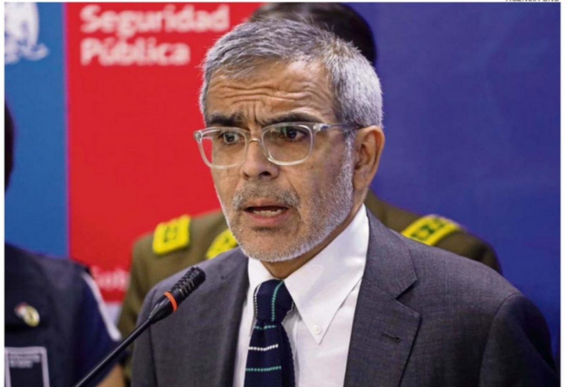
LUIS CORDERO, EX MINISTRO DE SEGURIDAD PÚBLICA EN EL GOBIERNO DE GABRIEL BORIC.

En ese sentido, sostuvo que iniciativas como Aula Segura o Escuelas Protegidas no son suficientes por sí solas para resolver el problema. “Hay que tener intervenciones más específicas”, remarcó, apuntando a que la convivencia escolar se ha transformado en un tema mucho más complejo que únicamente la aplicación de san-