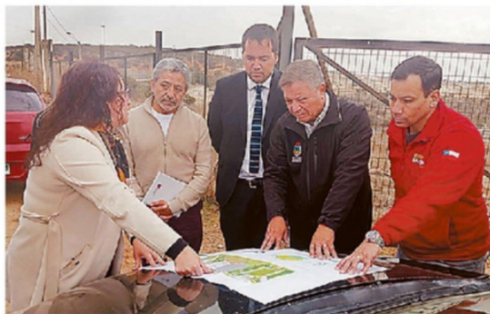
SE REALIZÓ UNA VISITA A LOS TERRENOS DONDE SE CONSTRUIRÁ.