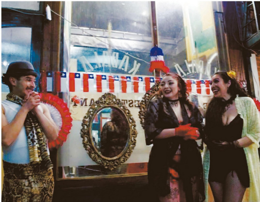
EL TRABAJO EN EL RUBRO ARTÍSTICO SE CARACTERIZA POR SU INTERMITENCIA Y LA ESCASEZ DE VÍNCULOS LABORALES FORMALES.

la pesca artesanal. A nivel regional, la mayor tasa de informalidad es la de los agricultores, trabajadores agropecuarios y pesqueros: supera el 55%.