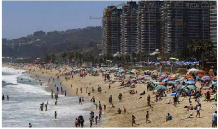
►Un 34% no ha visto gran diferencia en las conductas y un 15% cree que mejoraron.

Luego, estableciendo el escenario de las playas en temporada alta, Descifra consul-