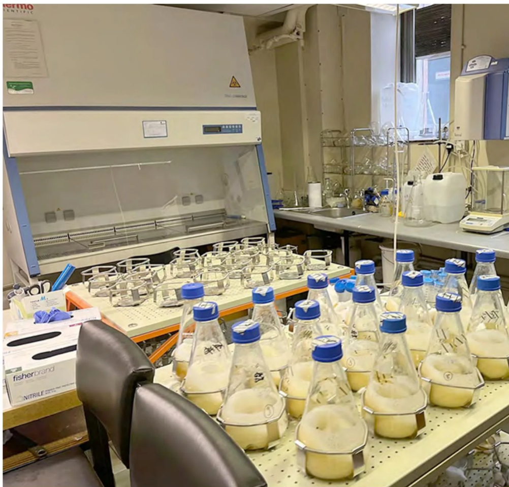
Cultivos bacterianos a gran escala para la extracción de metabolitos.