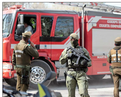
NÚMEROS.— Actualmente, Chile mantiene distintos números para contactar a Carabineros (133), Bomberos (132) y ambulancias (131).

Así, solo la policía uniformada contabilizó casi 5 millones 700 mil llamadas telefónicas el año recién pasado. Lo anterior, en sus 32 centrales de comunica-