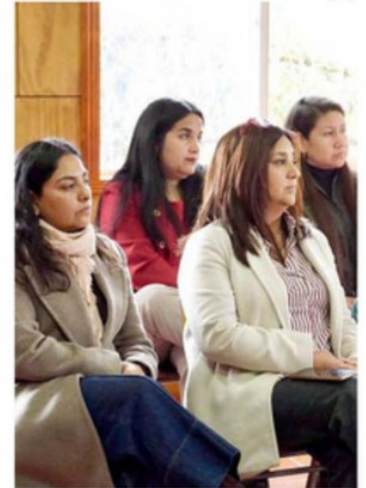
SENDA LOS LAGOS REALIZÓ UNA CAPACITACIÓN EN SALUD MENTAL.