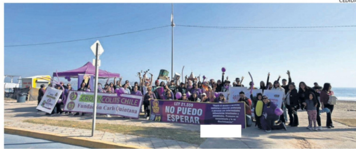
FUNDACIÓN CARLOS QUINTANA CROHN COLITIS COQUIMBO TUVO UNA RECIENTE REUNIÓN EL 16 DE MAYO.

Finalmente, la directora de la fundación filial Coquimbo destacó la reciente actividad de caminata del 16 de mayo en Coquimbo, además de invitar a todos los que no conocen de estas complejas enfermedades a que la conozcan y se informen, siendo la fundación un canal fiable para comunicar sus patologías. ☞