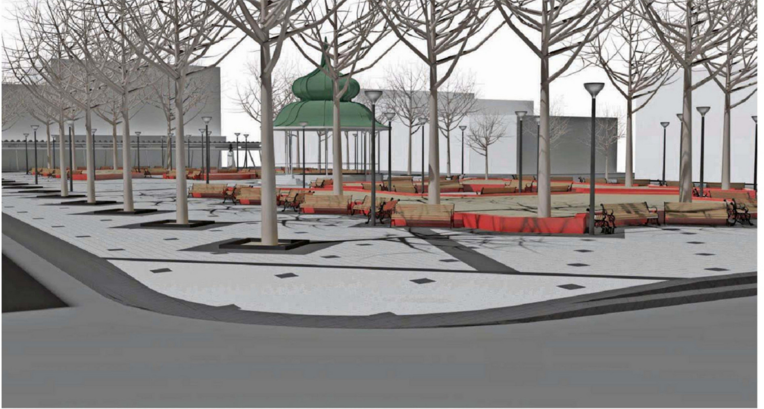
INTERVENCIÓN EN LA PLAZA DE LA REPÚBLICA ES PARTE DEL PLAN DE MEJORAMIENTO DEL CASCO HISTÓRICO DE VALDIVIA, SEGÚN EXPLICARON DESDE LA MUNICIPALIDAD.