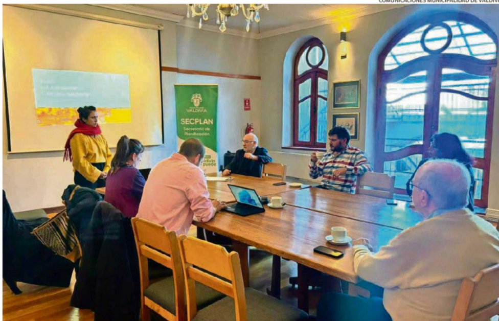
YA SE REALIZÓ UNA PRIMERA REUNIÓN CON ACTORES CLAVE DEL CENTRO DE VALDIVIA, A FIN DE ABORDAR ORDENANZA DE IMAGEN URBANA.

se llevó a cabo una reunión convocada por la Municipalidad a fin de abordar elaboración de ordenanza. Entre los participantes estuvieron representantes de la Cámara de Comercio.