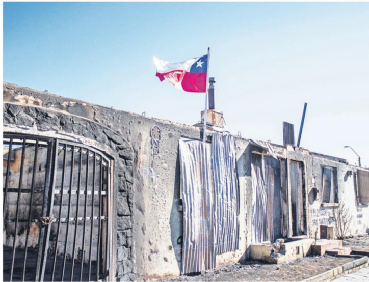
HAY MUCHOS SITIOS EN RUINAS QUE SON USADOS POR LOS DELINCUENTES PARA OCULTARSE

Además recalcó que "Igualmente nos hemos organizado un poco para hacer rondas nocturna