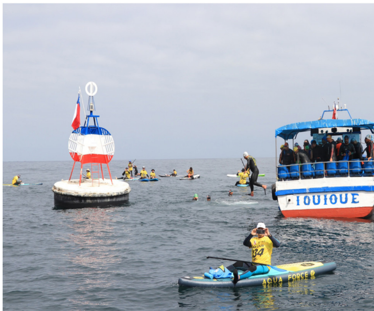
Los competidores iniciaron la prueba en el sitio exacto donde se ubica la boya de La Esmeralda.