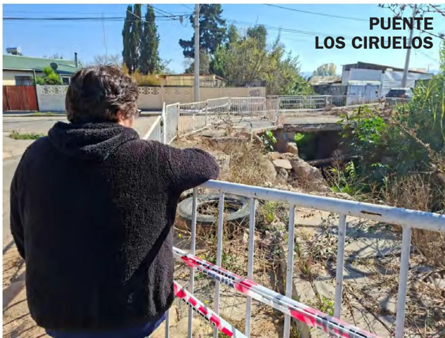
PUENTE LOS CIRUELOS

El proyecto de extensión de redes de agua potable y alcantarillado permitirá entregar una solución sanita-