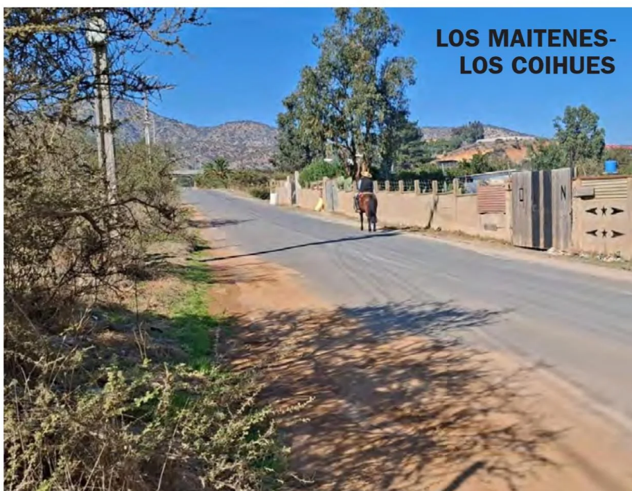
LOS MAITENES- LOS COIHUES