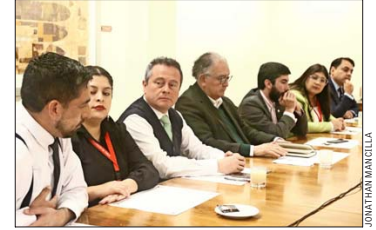
Senadores, diputados y parte de la directiva DC se reunió para adoptar la decisión de rechazar el proyecto.

Desde la Falange deslizan, en privado, que gran parte de la influencia por inclinarse por la opción de