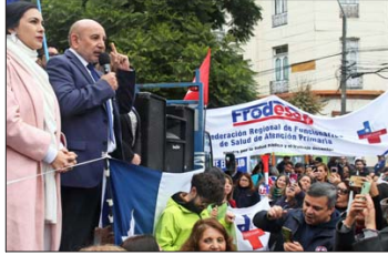
Diputados comunistas en el escenario junto al senador PS Juan Luis Castro.

El tema de las movilizaciones ha formado parte de