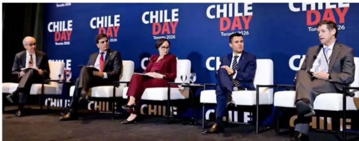
Representantes de compañías mineras, inversionistas, autoridades y actores del mercado financiero participaron en el Chile Day Toronto 2026, encuentro marcado por las discusiones sobre permisos, competitividad y el rol estratégico del cobre y los minerales críticos en la transición energética global.

Si un tema marcó las conversaciones en Toronto fue la capacidad de Chile para ejecutar proyectos mineros en plazos razonables. Más que el potencial geológico, el foco estuvo en los tiempos de tramitación, la coordinación institucional y la capaci-