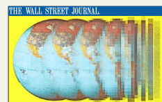
IMPACTO DEL GASTO: