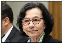
INFORME DEL B. CENTRAL