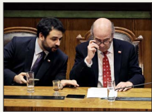
DISCUSIÓN DE PROYECTO MISCELÁNEO: