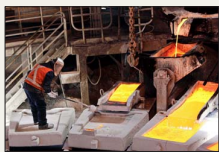
A US$ 5,5 PROMEDIO EN 2026:

BANCOS CUENTAN CON HOLGURAS PARA ENFRENTAR SHOCKS EXTERNOS | B 2