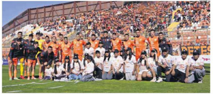
MENORES DE LA COMUNIDAD QUECHUA DE OLLAGÜE COMPARTIERON CON EL PLANTEL DE COBRELOA EN CALAMA.