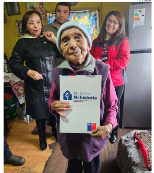
LA ADULTA MAYOR DE 93 AÑOS MUESTRA SU TÍTULO DE DOMINIO.