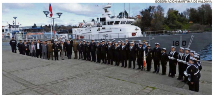
GOBERNACIÓN MARÍTIMA DE VALDIVIA

ESTUDIANTES DE LA CARRERA DE DERECHO DE LA UNIVERSIDAD SAN SEBASTIÁN, VISITARON LA GOBERNACIÓN MARÍTIMA DE VALDIVIA Y LA UNIDAD LSG CORRAL, PARA CONOCER EL QUEHACER DE LA AUTORIDAD MARÍTIMA DE LA REGIÓN DE LOS RÍOS.