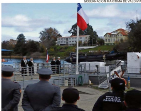
GOBERNACIÓN MARÍTIMA DE VALDIVIA