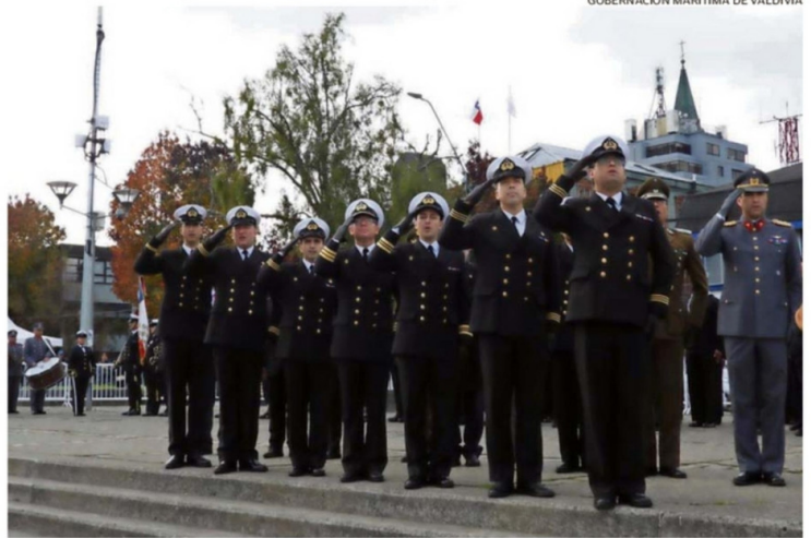
GOBERNACIÓN MARÍTIMA DE VALDIVIA