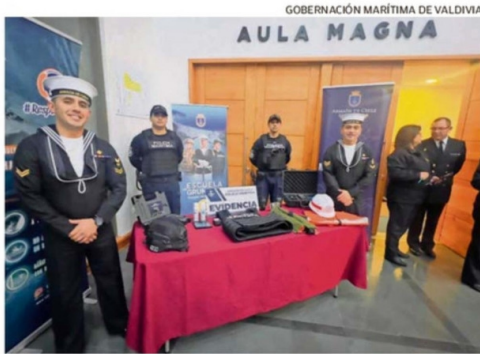
GOBERNACIÓN MARÍTIMA DE VALDIVIA

Posteriormente, a las 10 horas, está programada la tradicional Misa de Acción de Gracias en la Catedral de Valdivia, en la que participarán diversas