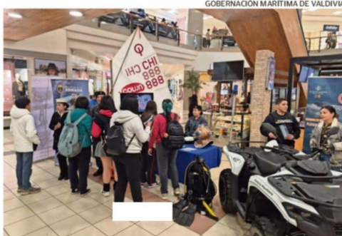
GOBERNACIÓN MARÍTIMA DE VALDIVIA