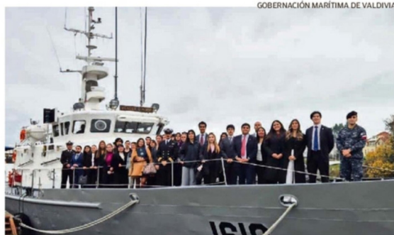
GOBERNACIÓN MARÍTIMA DE VALDIVIA

ESTUDIANTES DE LA CARRERA DE DERECHO DE LA UNIVERSIDAD SAN SEBASTIÁN, VISITARON LA GOBERNACIÓN MARÍTIMA DE VALDIVIA Y LA UNIDAD LSG CORRAL, PARA CONOCER EL QUEHACER DE LA AUTORIDAD MARÍTIMA DE LA REGIÓN DE LOS RÍOS.