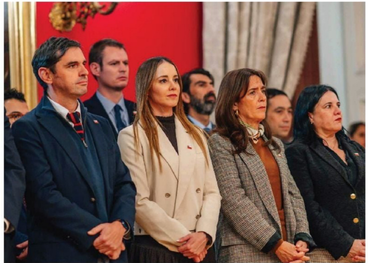
► El cambio de gabinete de Kast fue a 69 días de asumir en La Moneda.

Por último, ante la consulta "¿Cree usted que este cambio de gabinete podría facilitar la tramitación de la ley de reconstrucción que el gobierno negocia con el Parlamento?", la mayoría (47%) dijo que no; un 41% señaló que sí podría facilitar ese trámite legislativo, y un 12% dijo no saber o no contestar. ●