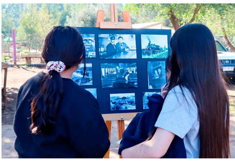
Son cien años de la llegada del tren a la comuna de Pichilemu.