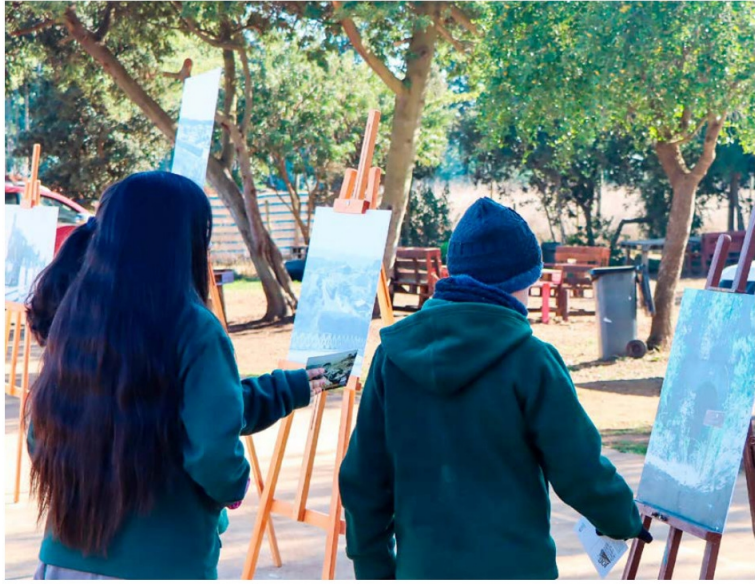
Sin duda una experiencia que permite a los escolares conocer la historia del tren en Pichilemu.