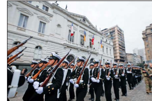
La escuadra de marinos desfilando en la Plaza de Armas frente a la Municipalidad de Santiago.