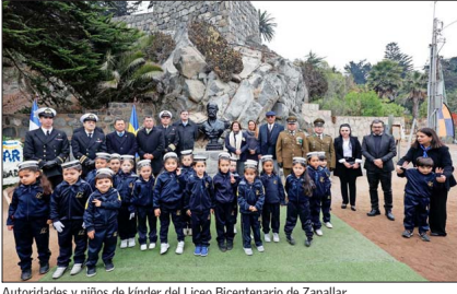
Autoridades y niños del kínder del Liceo Bicentenario de Zapallar.