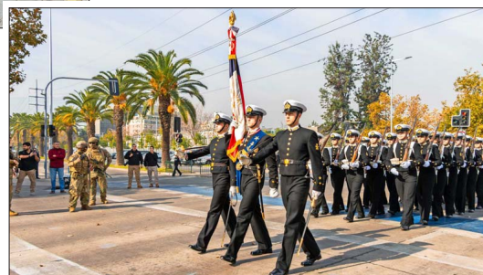
Frente al centro cívico de Vitacura se realizó el desfile conmemorativo.