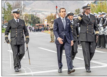
El alcalde de Lo Barnechea, Felipe Alessandri, junto al comandante general de Guarnición de la Primera Zona Naval, contraalmirante Raúl Silva, al iniciar el desfile que se realizó el 13 de mayo en la comuna.