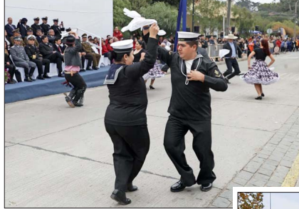
Un pie de cueca animó a los asistentes al comienzo del desfile de Zapallar.