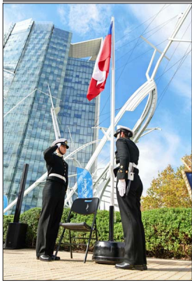
En Las Condes, durante el izamiento del pabellón patrio, el pasado miércoles 13 de mayo, y donde también se observa la escultura "Esmeralda II", del premio nacional de arte Francisco Gaztúa.