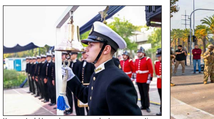
Un aspecto del toque de campana en el acto conmemorativo en Providencia.