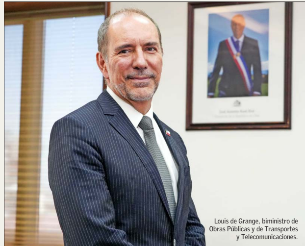
Louis de Grange, biministro de Obras Públicas y de Transportes y Telecomunicaciones.

La unificación de ambas carteras puede generar espacios para complementar decisiones de inversión en diversas áreas. Los peligros asociados a, por ejemplo, no poder abarcar las múltiples exigencias se podrían mitigar con equipos competentes y empoderados, especialmente los subsecretarios, indican los especialistas.